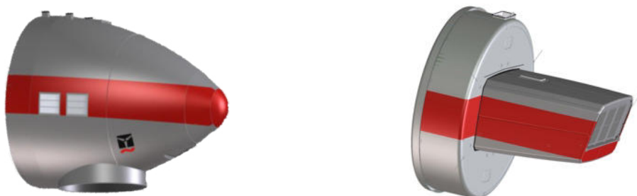
Abb. 4: Farbliche Kennzeichnung Gondel, Tropfenform (links), Kompaktform (rechts)

Zur farblichen Kennzeichnung der Gondel wird an der Gondel ein Farbstreifen in Verkehrsrot (RAL 3020) angebracht.