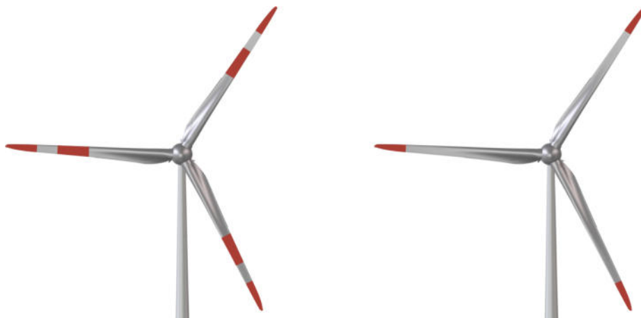
Abb. 3: Farbliche Kennzeichnung Rotorblatt

Zur farblichen Kennzeichnung der Rotorblätter werden 3 jeweils 6 m breite Streifen in den Farbtönen Verkehrsrot (RAL 3020), Achatgrau (RAL 7038) und Verkehrsrot (RAL 3020) oder ein 6 m breiter Streifen in Verkehrsrot (RAL 3020) angebracht.