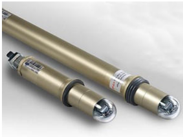
Abb. 2: Befeuerungsleuchte Turm

Durch behördliche Vorschriften kann eine Befeuerung des Turms gefordert werden. Dazu wird der Turm mit einer, seltener mit zwei Befeuerungsebenen mit jeweils 4 Stableuchten ausgerüstet. Eine Nachrüstung von Leuchten am Turm ist nur mit sehr hohem Aufwand möglich.